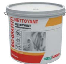
BIO GRAFFITI NETTOYANT (voir fiche p. 218)