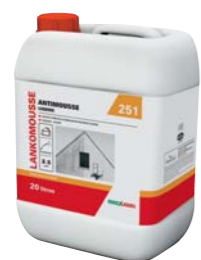
251 LANKOMOUSSE (voir fiche p. 194)