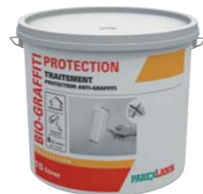
BIO GRAFFITI PROTECTION (voir fiche p. 218)