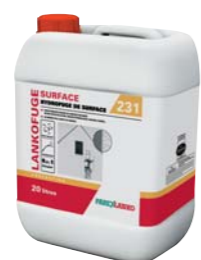
231 LANKOFUGE SURFACE (voir fiche p. 193)