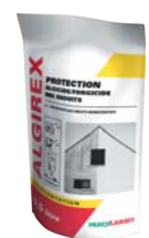
ALGIREX (voir fiche p. 217)