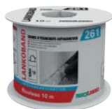
261 LANKOBAND (voir fiche p. 195)