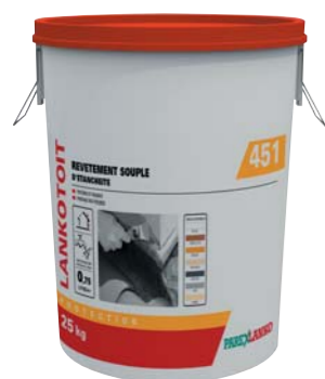
451 LANKOTOIT (voir fiche p. 199)