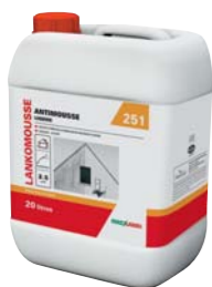
251 LANKOMOUSSE (voir fiche p. 194)