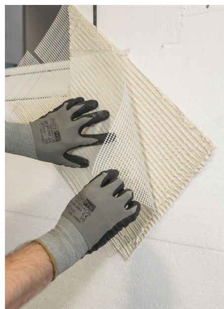
Réalisation d'un renfort d'angle en partie courante.