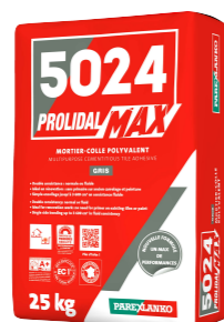
5024 PROLIDAL MAX