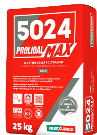
5024 PROLIDAL MAX