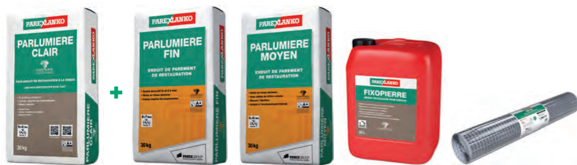
PARLUMIÈRE CLAIR Sous-enduit Voir fiche p. 167 PARLUMIÈRE FIN Finition Voir fiche p. 167 PARLUMIÈRE MOYEN Finition Voir fiche p. 168 FIXOPIERRE Voir fiche p. 161 TM 20 Voir fiche p. 169