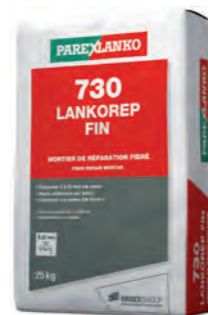
730 LANKOREP FIN