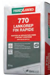
770 LANKOREP FIN RAPIDE