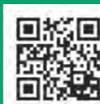
LA FICHE DE RECONNAISSANCE