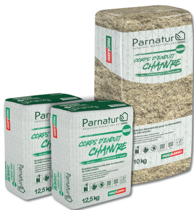
PARNATUR CORPS D'ENDUIT CHANVRE

Le fabricant mettra en exergue les deux premières solutions de sa gamme biosourcée PARNATUR : PARNATUR CORPS D'ENDUIT CHANVRE et PARNATUR ISOLANT FIBRES DE BOIS.